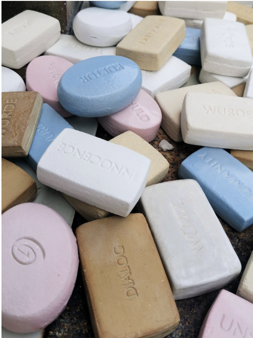
„Seife die nicht riecht“ verschiedene Keramische Techniken 2021

Quellidee: ... und vor allen Dingen: kannst Du eine Seife machen, die nicht riecht? (Materialsammlung „Aquagraphie“ 2016/2017)