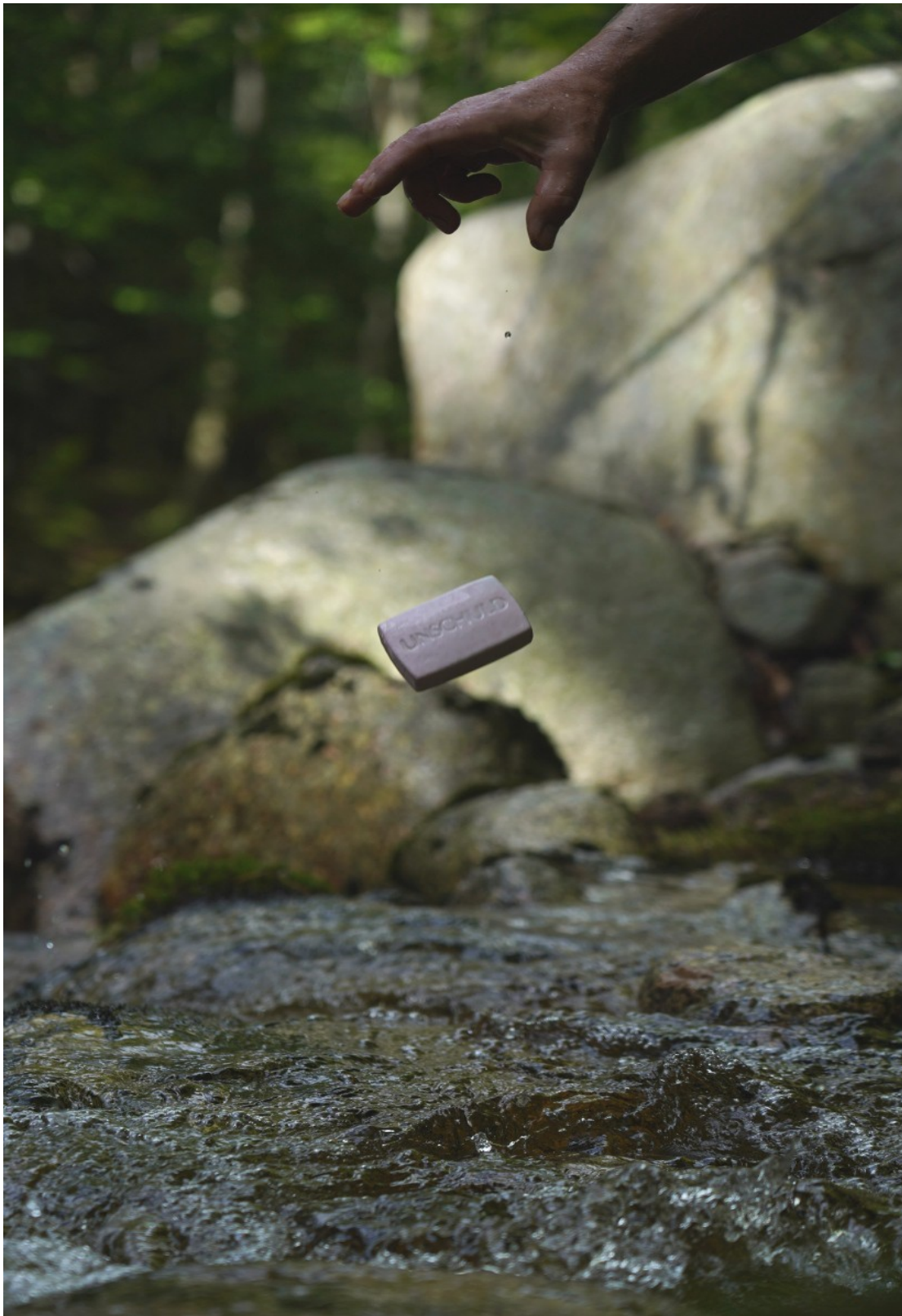
„Netzeintrag im Quellfluss“

Kultur bedeutet im Fluss zu bleiben (und diesem Fließen bewusst), nur so kann eine Information unbeschadet „den Bach hinunter gehen“.